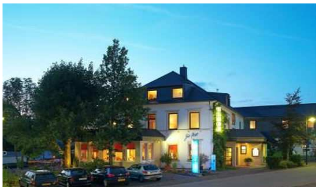
Hotel zur Post Hochwaldstr.1, 54427 Kell am See Tel.: 06589/ 9171-0 Mail: info@postkueche.de