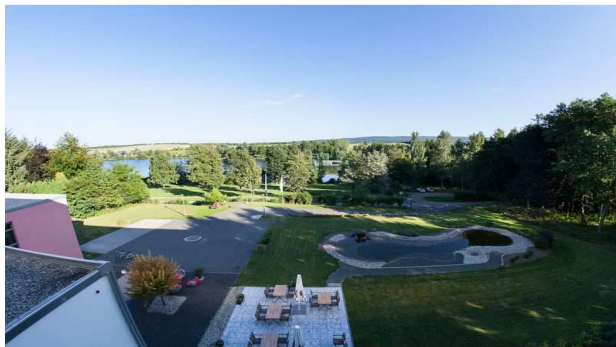
Seehotel Seeuferweg 1, 54427 Kell am See Tel.: 06589/ 18-0 Mail: info@seehotel-kell.de