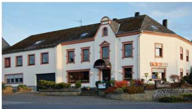
Hotel Typisch Hochwaldstr.1, 54427 Kell am See Tel.: 06589/ 6589-346 Mail: info@hoteltypisch.de